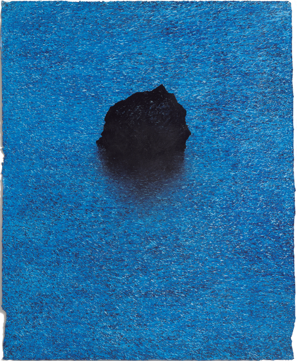
Hugo Fontela para la UIMP, 2018