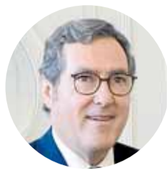
Antonio Garamendi Presidente de la CEOE

«El sector espacial siempre ha estado asociado con el ámbito científico o el militar, pero hoy en día realmente es un tema económico»