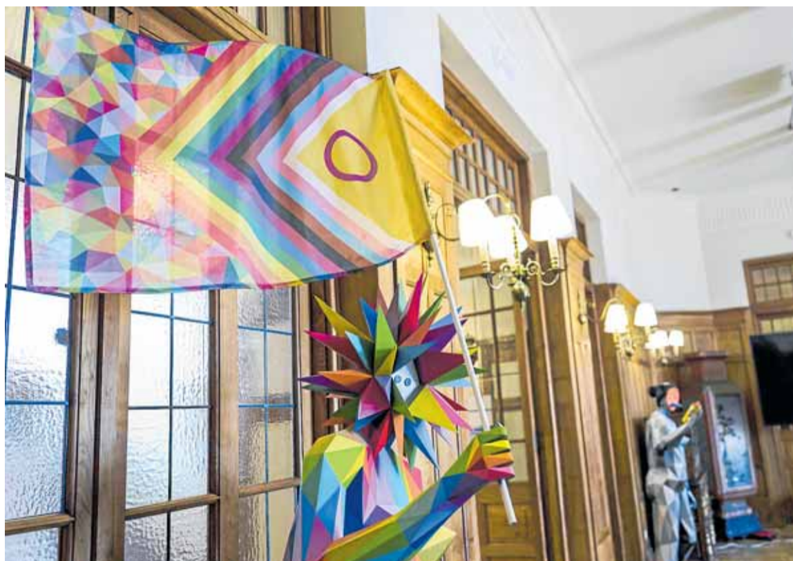
Detalle de la instalación de la escultura interior multicolor 2024, 'Venus 2024' y, al fondo, 'Venus Spray, 2020'.

Color y diversidad. Mirada al mundo y pensamiento crítico. Pintura y escultura y dibujo satírico. Okuda y El Roto. Del primero, su 'Bear Playing World', presidirá desde mañana la fachada sur del Palacio de La Magdalena. Del segundo, una selecta colección de viñetas rotará por los espacios de la sede de los Cursos. Ambas citas expositivas acompañarán durante todo el verano la actividad académica y cultural de la UIMP.