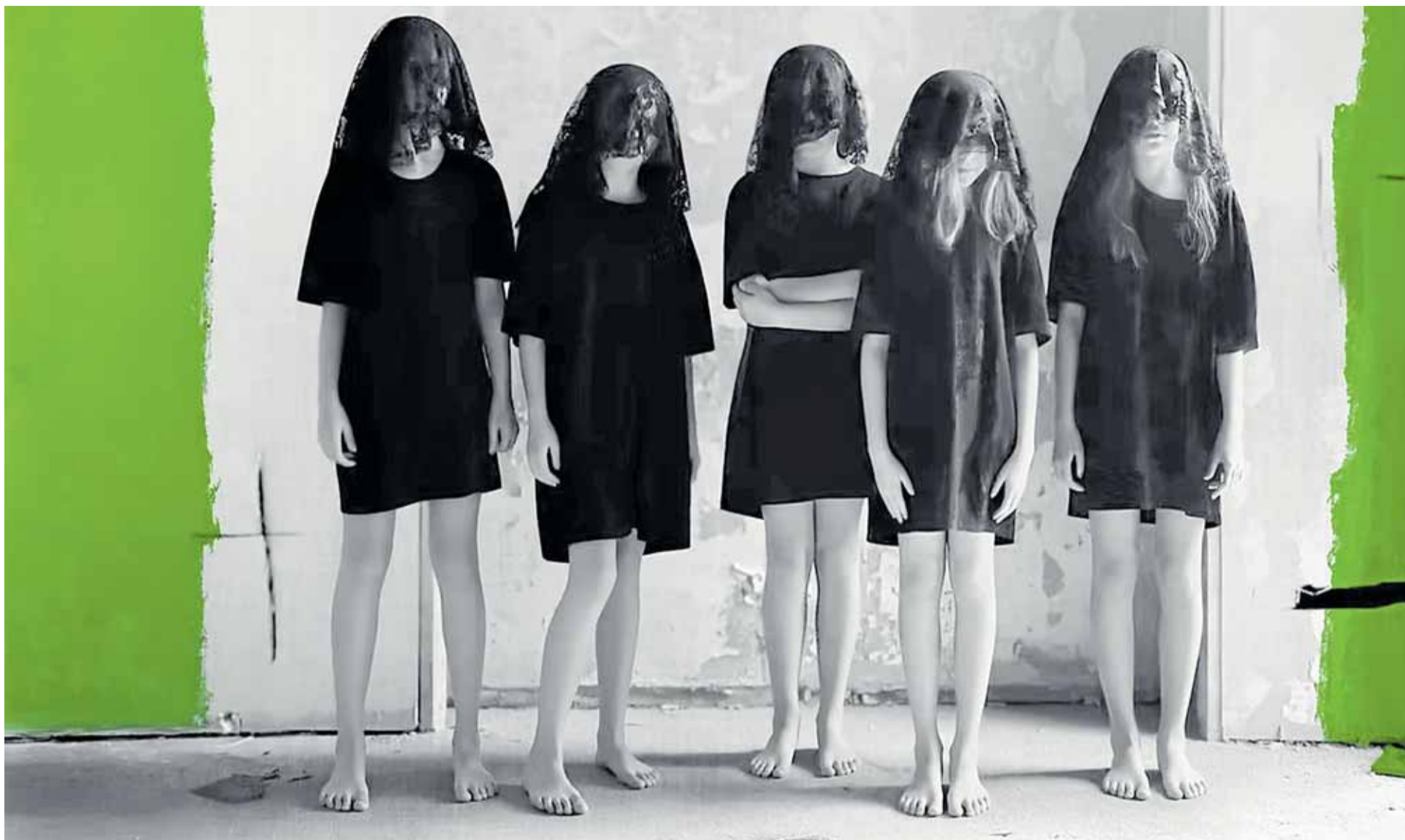
La danza contemporánea sumerge al espectador en un drama de represión y encierro femenino, revisitando el clásico universal 'La casa de Bernarda Alba' de Federico García Lorca. TAIAT DANSA