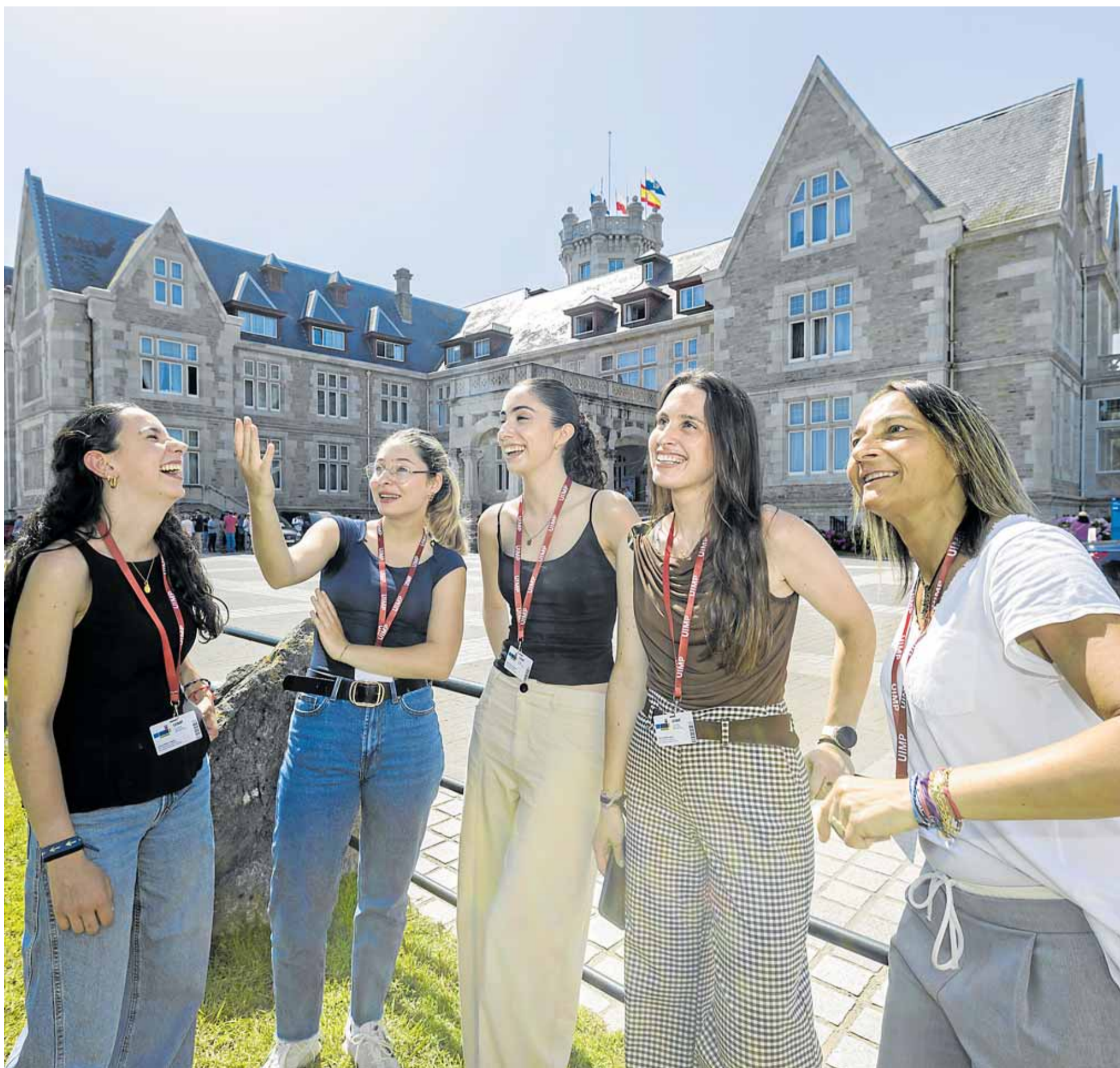
Jóvenes estudiantes matriculadas en los Cursos de la UIIMP, esta pasada semana frente al Palacio de La Magdalena. ROBERTO RUIZ