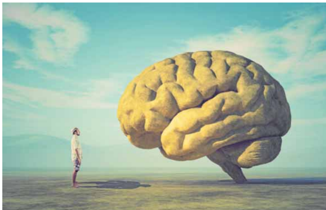
Los marcos filosóficos de la neurociencia del siglo XXI, uno de los debates de la semana. DM

El 2 y 3 de julio se celebra el encuentro '5th Banco de España CEMFI-UIMP' donde investigadores presentarán sus trabajos sobre temas importantes para la economía española y que contará con el gobernador del Banco de España, José Luis Escrivá; y, finalmente, el 'V Encuentro sobre SmallSats' que tiene como fin «ofrecer un espacio de análisis sobre las principales dinámicas de la economía espacial».