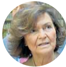
Carmen Calvo Presidenta del Consejo de Estado

► Financiación Autonómica. El director ejecutivo de la Fundación de Estudios de Economía Aplicada analiza la cara y cruz del modelo en 'La reforma de la financiación autonómica: qué cambiar y mantener en el nuevo sistema'.