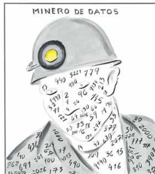
Dos de las viñetas de 'Cuestionario', muestra en rotación de El Roto durante el verano. VETA BY FER FRANCÉS

de los Cursos de Verano 2026: inteligencia artificial, sostenibilidad y geopolítica. Bajo el epígrafe 'Cuestionario', el pintor y viñetista Andrés Rábago, El Roto, exhibirá en caballetes, a modo de un circuito itinerante, para dar el máximo de visibilidad durante la etapa académica. En esta inauguración