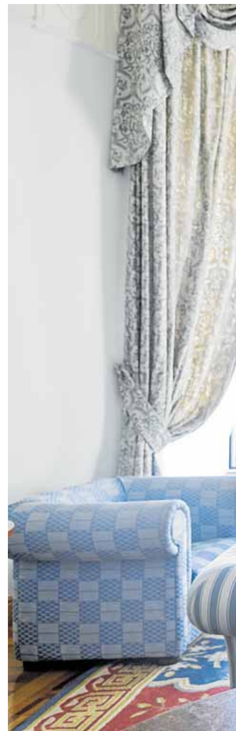
«Los cántabros teneis suerte de disfrutar de esta»

–Significa dos cosas. En la medida en la que nosotros somos un organismo autónomo del Ministerio de Ciencia y, junto con la UNED, una universidad